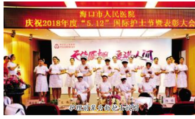
护理前辈为新护士授帽

我为护士事业奋斗30年 光阴荏苒,岁月如梭。颁奖仪式的第一项,是给那些为了护理事业奋斗了大半生的前辈们。1988-2018,她们用自己生命中最灿烂的时光,丈量了护理事业蓬勃发展的30年,更见证了海南建省办经济特区的30年。而今,习近平主席郑重宣布,党中央决定支持海南全岛建设自由贸易试验区,这给了海南又一次腾飞的机会。护理前辈们站在历史的风浪渡口,发扬着“传、帮、带”的优良传统,尽可能地把自己的技能和经验传给护理的新生力量们!(陈希)